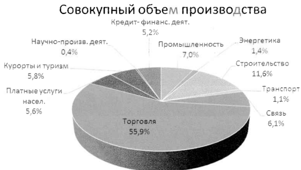
Рис.1. Долевое соотношение отраслей по совокупному объему производства

Долевое соотношение отраслей по совокупному объему и прибыли представлено на рис.1 и 2.